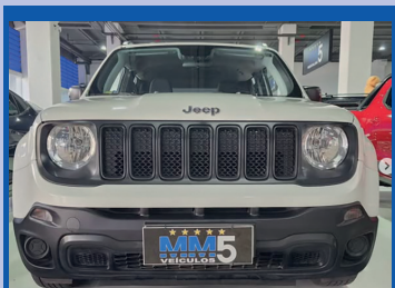
JEEP RENEGADE 1.8 AUTOMÁTICO 2021 De R$ 85.900,00 Por R$ 83.900,00