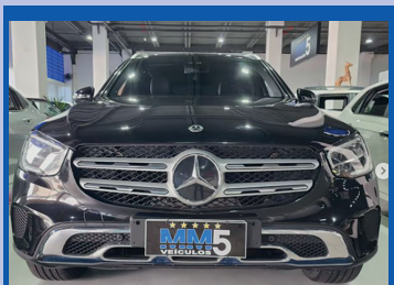
MERCEDES-BENZ GLC 220D 2020 De R$ 249.900,00 Por R$ 235.900,00