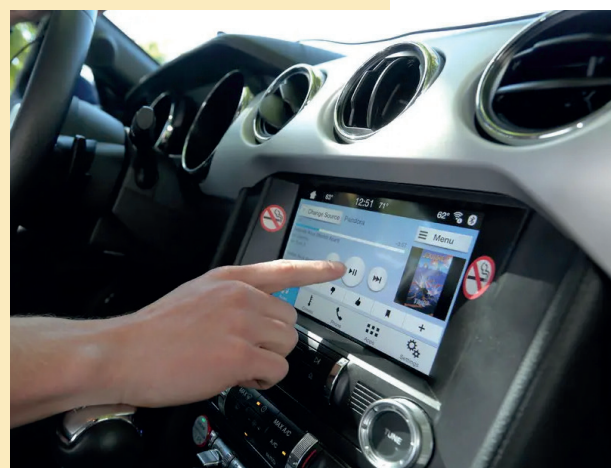
Ajustes ao toque de um dedo.

pressão do turbo e temperatura do óleo, disponíveis de fábrica no Polo, Virtus GTS e no Jetta GLI.