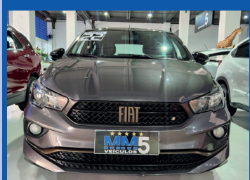
FIAT CRONOS DRIVE 1.3 MANUAL 2022

Motor: 1.6 Flex Ar condicionado Direção elétrica Vidros elétricos Travas elétricas Apple CarPlay e Android Auto Câmera de ré Controle de estabilidade e tração