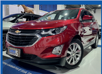
CHEVROLET EQUINOX LT 2.0 TURBO 2019

Transmissão automática de 9 marchas com tração integral Tanque de combustível: 59 litros Porta-malas: 468 litros Airbags: frontais, laterais e de cortina Direção assistida: Elétrica Sistema de som: Premium