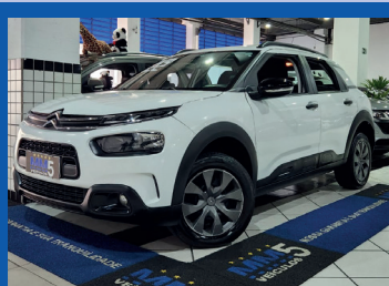
CITROËN C4 CACTUS FEEL 2022

Transmissão automática de 9 marchas com tração integral Tanque de combustível: 59 litros Porta-malas: 468 litros Airbags: frontais, laterais e de cortina Direção assistida: Elétrica Sistema de som: Premium