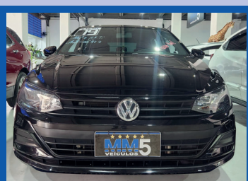
VOLKSWAGEN POLO 1.6 AUTOMÁTICO 2019

Motor: 1.3 Firefly Flex 8V Ano: 2022 Direção: Elétrica Progressiva Ar-Condicionado Central Multimídia Volante Multifuncional Rodas: Liga leve aro 15"