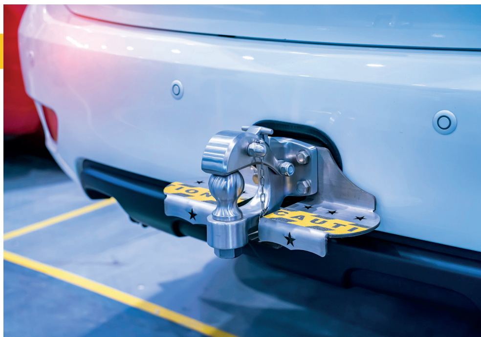
Engate de reboque pode causar retenção do veículo.

considera infração grave realizar essa mudança sem autorização, sendo necessário atualizar o CRLV-e com a nova cor do veículo. Conforme a Resolução 960/2022, do Contran , os vidros devem manter níveis mínimos de transpa-