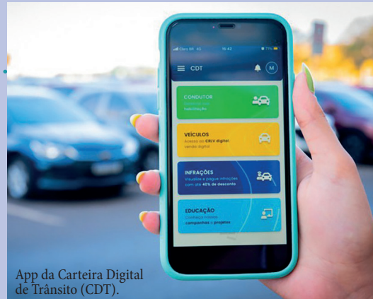
App da Carteira Digital de Trânsito (CDT).