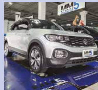
T-CROSS Highline 1.4 250 2020 | 64.289 Câmbio Automático Air bag. Freios ABS Bancos em couro