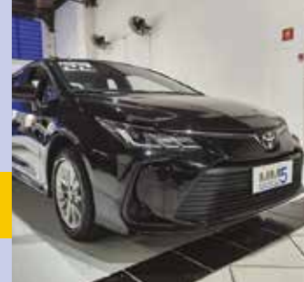
COROLLA GLI 2.0 2022 | 52.615 KM Potência: 177 CV Câmbio Automático Kit Multimídia (CARPLAY)

Você está pensando em trocar carro? Então, não perca tempo. Dê um pulo até a MM5 Veículos no Shopping SP Market (Avenida das Nações Unidas, 22540 – em Santo Amaro) e conheça nossos produtos. A loja trabalha exclusivamente com carros seminovos de boa procedência, em perfeito estado de conservação, documentação em ordem e com preços competitivos. Confira aqui seis modelos que estão em nosso showroom . Tem mais indicações no Instagram @mm5veiculos . WhatsApp: (11) 93049-6155 .