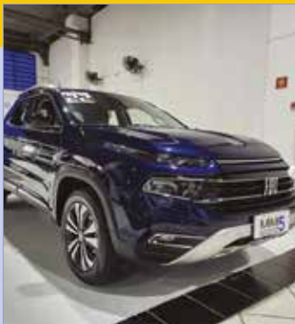
TORO VOLCANO 1.3 (TURBO) 2022 | 30.755 KM Potência: 170 CV Câmbio e piloto automáticos Volante multifuncional