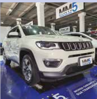
COMPASS LONGITUDE 2019 | 70.343 KM Potência: 170 CV Câmbio automático Bancos em couro