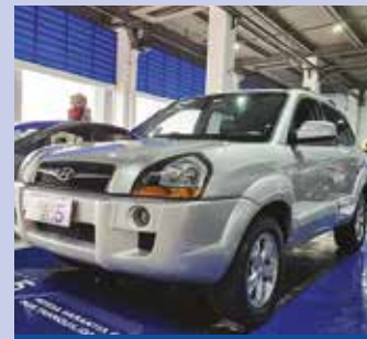
TUCSON GLS 2.0 2015 | 108.51 KM Potência: 146 CV Som (MULTIMÍDIA) Rodas de liga Computador de bordo