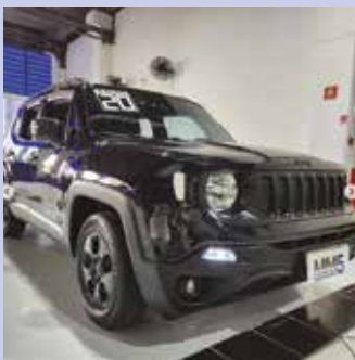
RENEGADE 1.8 2020 | 71.555 KM Câmbio Automático Air bag. Ar condicionado Volante com regulagem